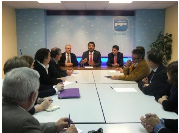
El Viceconsejero con la Comisión Provincial de Sanidad