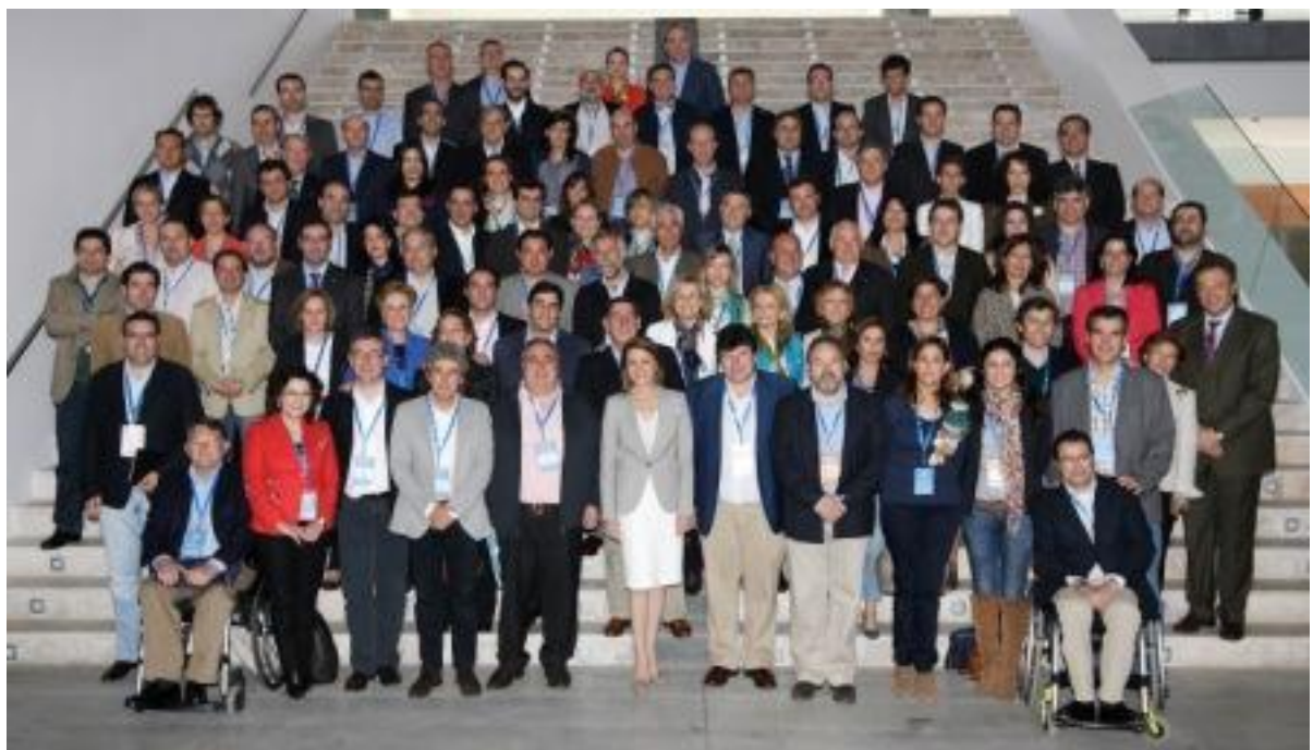
Comité Ejecutivo Autonómico