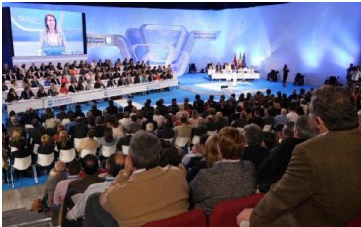
Intervención de M a Dolores Cospedal

La presidenta del PP de Castilla-La Mancha y secretaria general de esta formación a nivel nacional, María Dolores Cospedal, ha destacado que desde que el PP llegó al Gobierno de la comunidad, su principal misión se ha convertido en “construir en Castilla-La Mancha una nueva mayoría social en torno al Partido Popular; una mayoría social que aúne esfuerzos y aproveche lo mejor que cada uno lleva dentro de sí”.