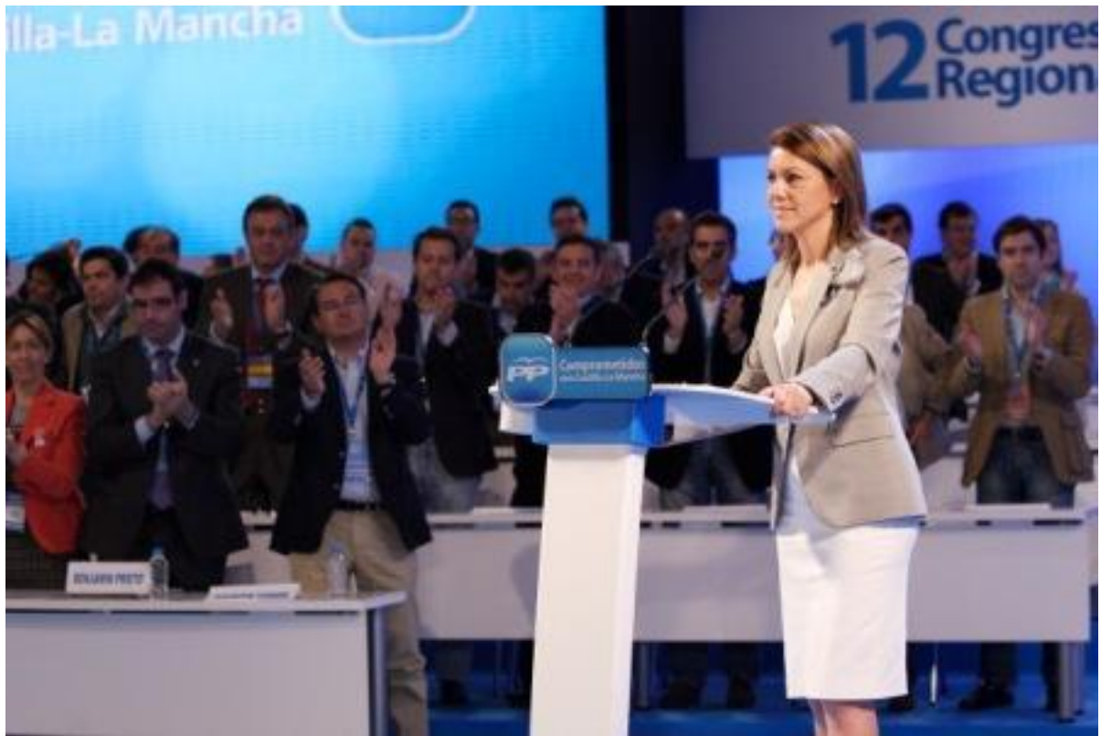
M a Dolores Cospedal