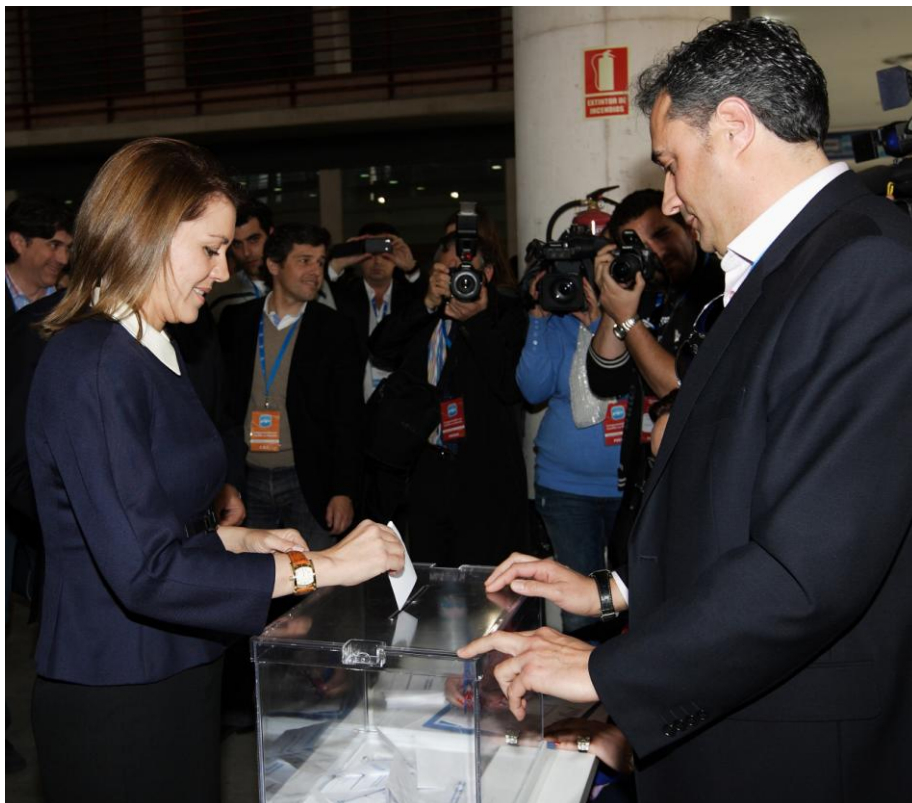
Mª Dolores Cospedal fue reelegida con el 98'8 % de los votos