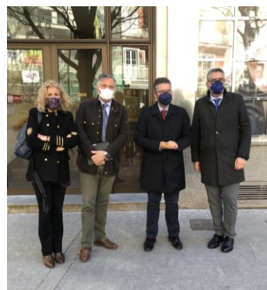
Moreno en Ciudad Real

Moreno Moya ha asegurado que "cuando se cumple un año del inicio de la pandemia, los datos reflejan que Castilla-La Mancha ha estado nefastamente gestionada por Emiliano García-Page, al frente de un gobierno que ha sido incapaz de gestionar la sanidad y hacerle frente al virus". "Page se ha olvidado de gestionar políticamente la pandemia y se ha olvidado fundamentalmente de los profesionales sanitarios, que desde el principio han sido las personas que han tratado de colaborar y han sido desoídos, insultados por Page, a quien le hubiera valido más escucharlos para haber tenido otro criterio diferente y no haberlo hecho simplemente rodeado de todos aquellos cargos del PSOE que son subdirectores generales, y que han estado tomando las decisiones de la gestión sanitaria y así nos ha ido".