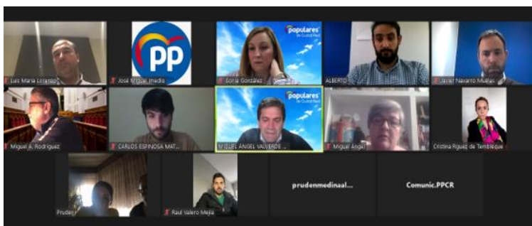
Reunión Vicesecretaría de Territorial y Desarrollo Rural

Los populares de los municipios de La Mancha Norte denuncian la “flagrante” desatención sanitaria, por parte del Gobierno regional, que padecen los vecinos de esta comarca