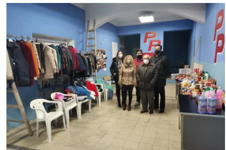
Afiliados del PP de Villarta

El PP-Villarta ha donado a Cáritas y a la Parroquia de la localidad, alimentos, productos de higiene, productos limpieza y ropa nueva, para que se encarguen de hacer llegar a las familias que más lo necesiten esta pequeña ayuda, “ya que debido a la pandemia y al temporal hay muchas familias que lo están pasando muy mal y que se encuentra en riesgo de pobreza”. Con esto queremos dar visibilidad y poner en valor el derecho de todas las personas a cubrir sus necesidades básicas, así como promover la solidaridad y reafirmar nuestro compromiso con los más desfavorecidos en estos momentos tan difíciles que nos están tocando vivir.