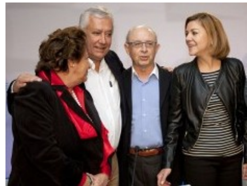
Barberá, Arenas, Montoro y Cospedal