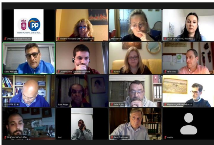
Reunión de la Vicesecretaría con responsables del deporte local

El PP local reitera la necesidad de que el Ayuntamiento apueste por mejorar las instalaciones deportivas