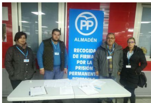
Miembros del PP en la recogida de firmas

Dentro de la campaña de recogida de firmas contra la derogación de la Ley de Prisión Permanente Revisable que lleva a cabo el Partido Popular a nivel nacional, miembros del PP Almadén han recogido firmas entre nuestros conciudadanos. “Agradecemos la colaboración de todos en un tema tan importante para nuestra sociedad como es la seguridad ciudadana”. “El cumplimiento íntegro de la sentencia cuando no hay voluntad de reinserción ni arrepentimiento por parte del reo no merma sus derechos, pero si garantiza que éste no cometerá el mismo delito”.