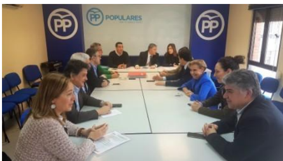
Comité de Dirección