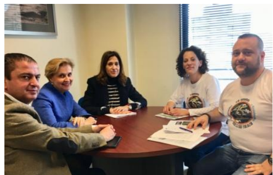
Los diputados nacionales con la Asociación

“Desde el Ministerio de Defensa nos consta que están esperando las conclusiones de esta Subcomisión”, han señalado los diputados del PP quienes se han comprometido a trasladar las reivindicaciones de la Plataforma, avanzando que próximamente comparecerá el Subsecretario de Defensa.