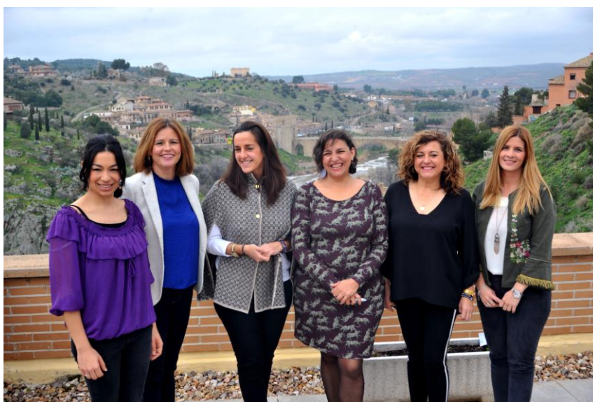
Diputadas del Grupo Parlamentario Popular en las Cortes de Castilla La Mancha

Las diputadas regionales del Grupo Parlamentario Popular en las Cortes de Castilla-La Mancha han pedido “seguir trabajando, todos juntos y de la mano, en favor de la igualdad”. Han resaltado las medidas puestas en marcha por el Gobierno de Rajoy, como es el caso de las medidas en relación con las mujeres autónomas y en el ámbito rural. “Cuando el PP ha pedido que en nuestra región haya escuelas de 0 a 3 años en el mundo rural, o que los centros de la mujer puedan prestar ayudas itinerantes, o que se destinen ayudas para evitar la despoblación en el mundo rural, hayamos obtenido del Ejecutivo autonómico un no por respuesta”. “Nos gustaría tener un presidente en esta región que apostara por la maternidad, porque la maternidad no puede ser un impedimento para la igualdad de oportunidades, ni puede ser un obstáculo en el progreso ni en la carrera profesional, ni una disminución de derechos, por eso, lamentamos que Page haya eliminado el Programa Operativo de Apoyo a la Maternidad por el mero hecho de que lo puso en marcha el anterior Gobierno del PP en la región”. “Nos gustaría que esta región no fuera la de menor peso para las mujeres autónomas, al ser la comunidad con menor representación de las mujeres en el colectivo de los autónomos, tan solo el 30,2% frente al 35,3% de media estatal”. “Frente a esto, un Gobierno a nivel nacional del PP con la nueva modificación de la ley de autónomos coloca a las mujeres emprendedoras en el sitio que se merecen”.