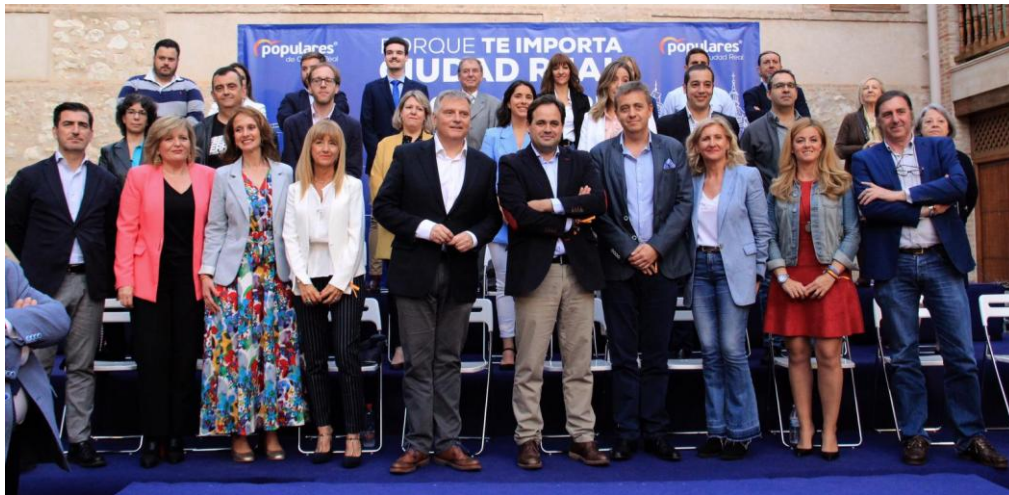
Paco Núñez con los candidatos al Ayuntamiento de Ciudad Real

Núñez ha resaltado que “Paco Cañizares es el mejor candidato para recuperar la Alcaldía de la ciudad y situar a Ciudad Real donde se merece, porque hay que recuperar los cuatro años perdidos por culpa de los Gobiernos socialistas”. Por ello, “Cañizares será el próximo alcalde de Ciudad Real y conseguirá el mejor futuro para la ciudad, logrando mejorar la calidad de vida de los vecinos”.