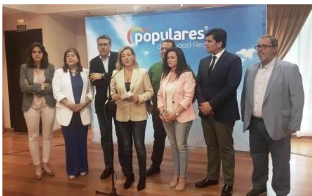
Candidatura Autonómica por Ciudad Real