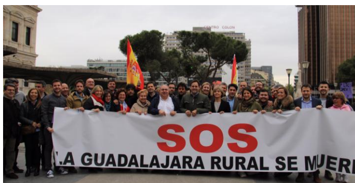
Núñez con la delegación del PP-CLM

Núñez ha resaltado que desde el PP regional "apostamos por el mundo rural y por la vida de nuestros pueblos en un región eminentemente rural como la nuestra, que tiene un problema de despoblación y que hay que trabajar por combatirla". Ha anunciado medidas que pondrá en marcha cuando sea presidente regional a partir de mayo, como es "flexibilizar la normativa para poder facilitar emprender en el medio rural, así como extender bonificaciones en el impuesto de autónomos al medio rural y apostar por ayudas activas en la renta para que sea más atractivo vivir y desarrollar un negocio en medio rural". "También hay que trabajar para que el medio rural tenga una cobertura importante en materia de telecomunicaciones y llegue internet en calidad". Ha resaltado la importancia de "fijar la población, con políticas que ayuden a la maternidad y siendo capaces de que el medio rural sea una alternativa real, eficaz y atractiva". "Si queremos que nuestros pueblos sigan vivos, hay que apostar por el empleo y darles las facilidades necesarias para que tengan la capacidad de atraer".