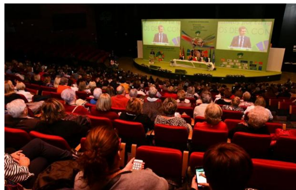
Asistentes a la Conferencia