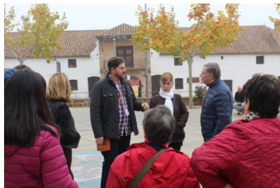
Francisco Cañizares en Almadén

Así se ha referido, en su visita a Almadén, con motivo de las II Jornadas Culturales y de la Naturaleza, que ha organizado el PP de la localidad, de la mano del secretario regional de despoblación y presidente del PP de Almadén, Miguel Ángel Araujo. Cañizares ha asegurado que “el Gobierno regional no ha apostado ni por la creación de empleo, ni por el desarrollo económico en las zonas rurales de nuestra tierra, prueba de ello es el Plan Especial para la comarca de Almadén, dotado de 500 millones de euros, que Page prometió en febrero de 2016 y que es un engaño más para el municipio y su comarca”. “El PP aboga por la defensa del mundo rural como pilar fundamental y básico de nuestra economía regional”.